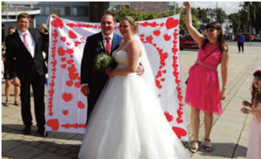
(das frisch vermählte Ehepaar nach der Trauung in der Marienkirche)

Auch wenn sich die beiden nicht beim Schwimmen kennen gelernt haben, das Schwimmen gehört seit vielen Jahren zu Ihrem Leben dazu und so ganz ohne „unsere“ Kids möchten sie (soweit ich das beurteilen kann) auch nicht sein und deshalb gab's nach der Trauung die Überraschung, dass die Schwimmkids (und Erwachsenen) ein Spalier für die Beiden bildeten ☺