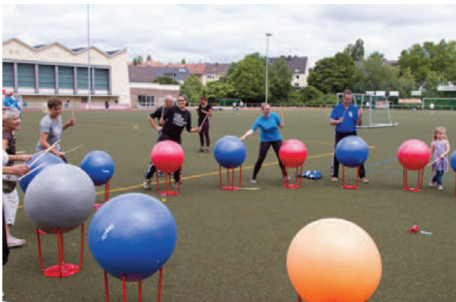
Eine Sportart für Jung und Alt