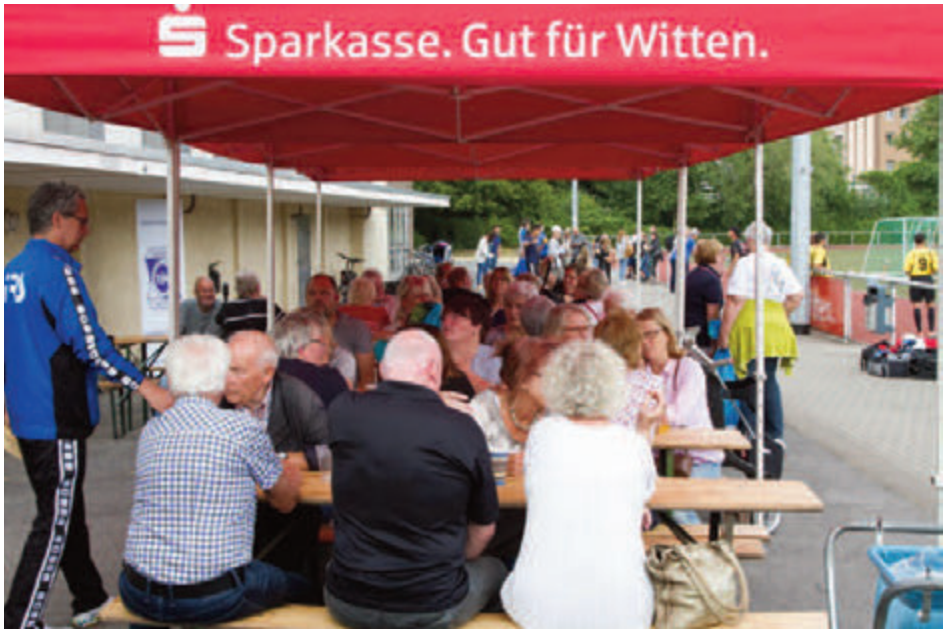
Traumhaftes Wetter und gut gefüllte Plätze