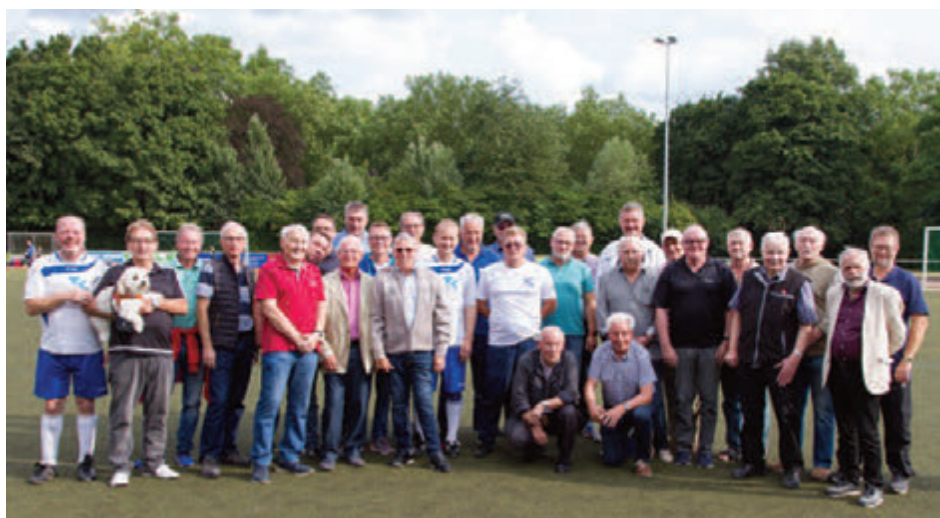
Klassentreffen der ehemaligen Fußballer