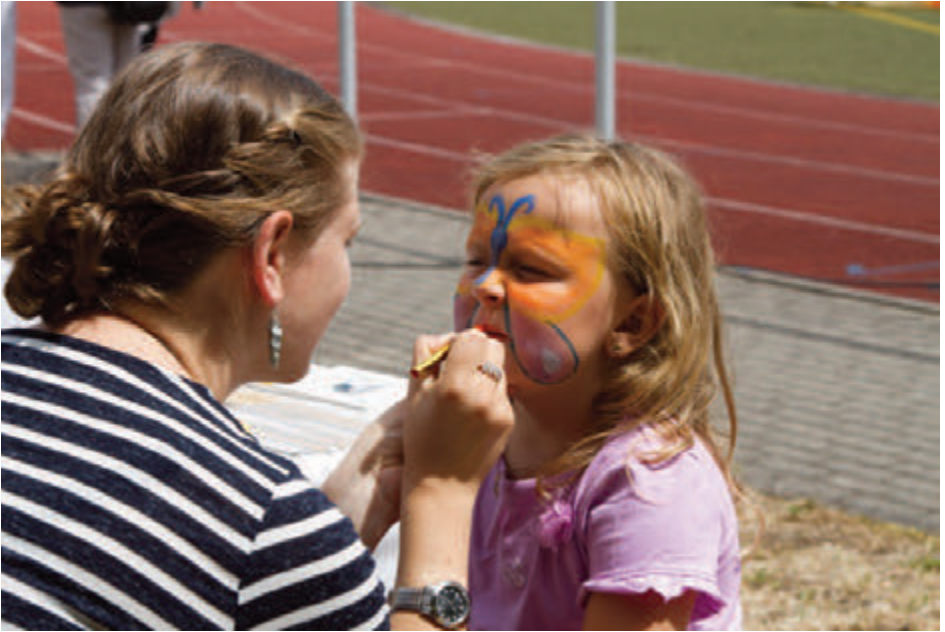
Kreativität für unsere Kleinen