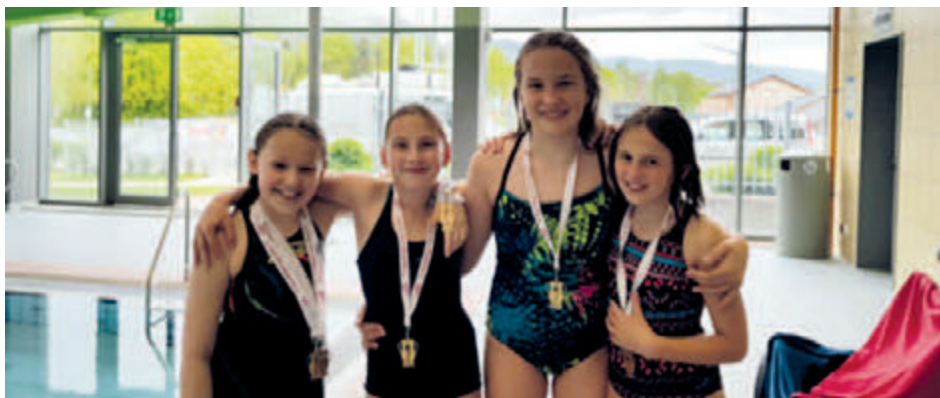
(unsere junge und erfolgreiche Damen-Staffel )