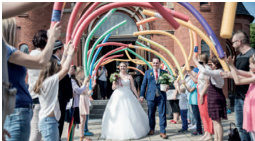
(natürlich ein Spalier mit Pool-Nudeln...ganz Schwimmer-like ☺ )