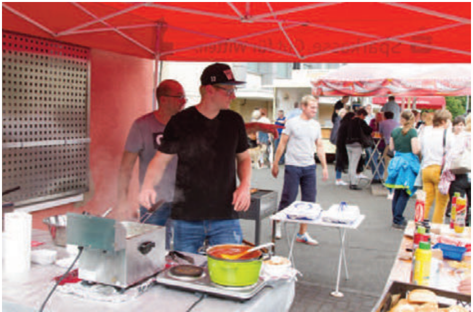
„Pommes“ macht Pommes