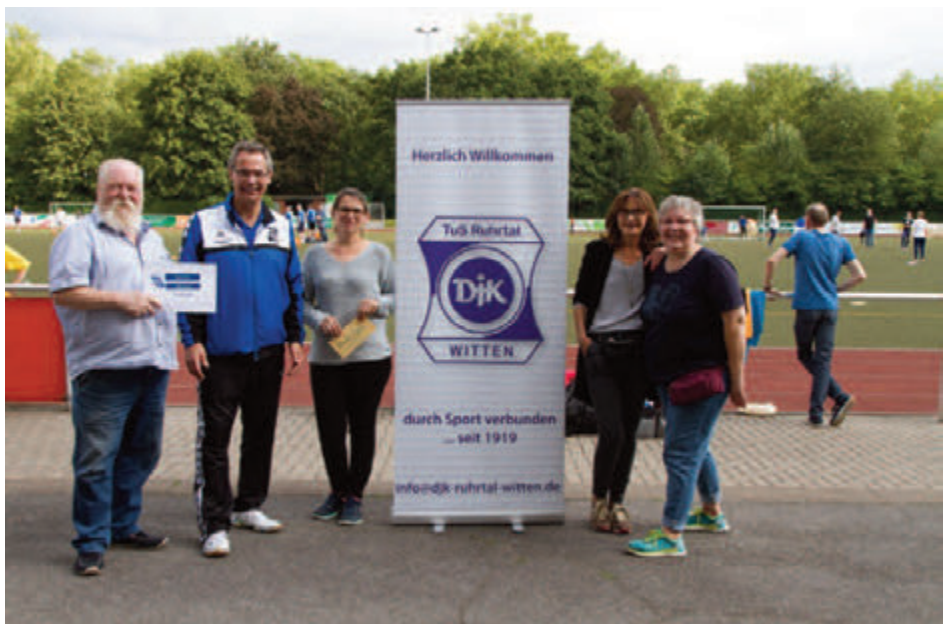
Spendenübergabe an die Ruhrtalengel