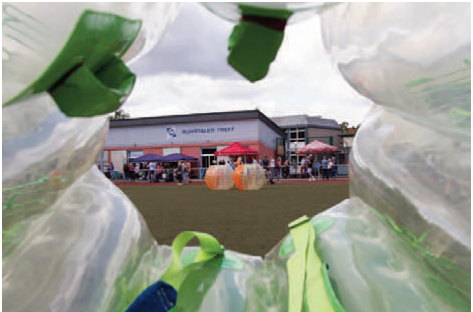
Eine besondere Sicht auf die Dinge