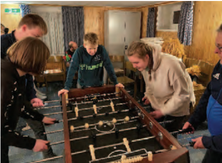
(Konzentration beim Kickerturnier)