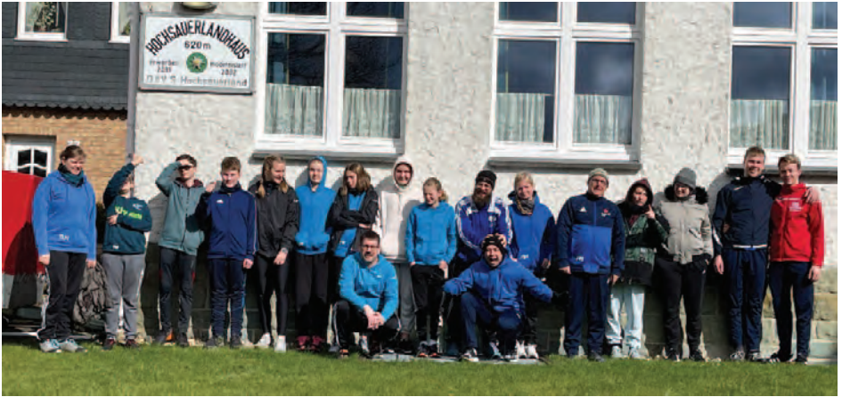
(Die bunt gemischte Truppe gut gelaunt vor dem Haus)