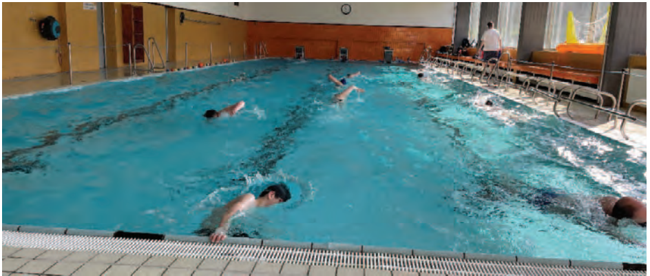
(Bahnen Ziehen beim Sponsorenschwimmen)