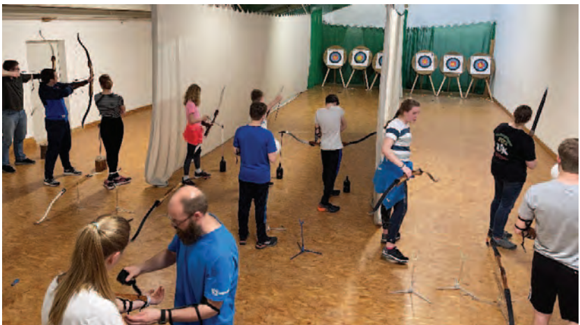
(Konzentration beim Bogenschießen)