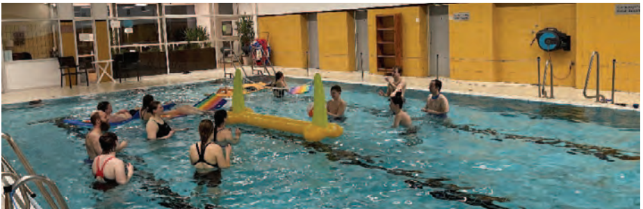
(eine Runde Wasser-Volleyball zur Auflockerung )