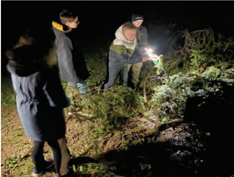
(wer findet den nächsten versteckten Hinweis bei der Nachtwanderung)