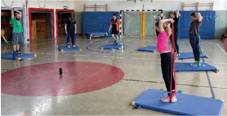
(Athletik-Training in der Sporthalle)