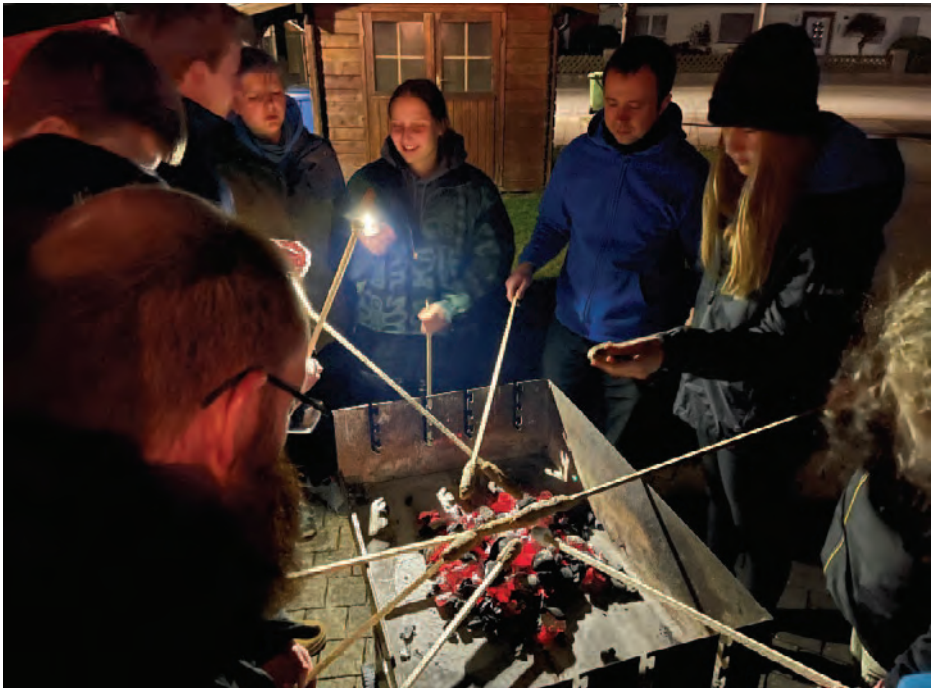
(noch ne Runde Stockbrot als Abschluss der Nachtwanderung)