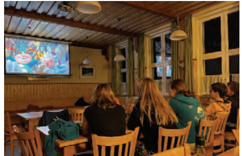
(der Filmabend durfte nicht fehlen)