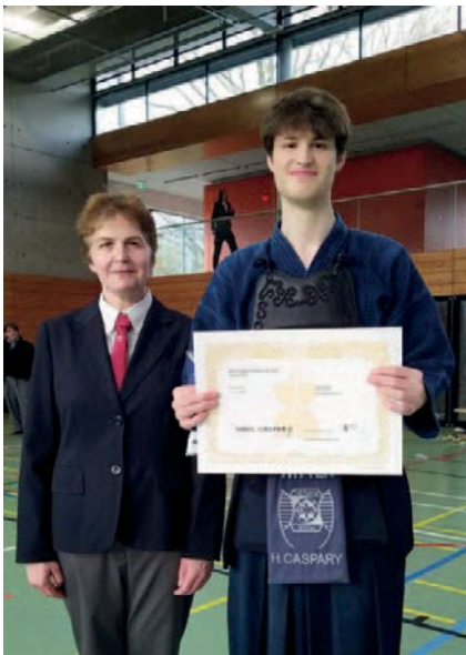
Deutscher Jugend-Cup 2023