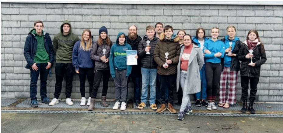
(das gemeinsame Team von BW Annen und Ruhrtal)

Schauen wir mal, wie die nächsten Wettkämpfe so weitergehen, auf jeden Fall war Meschede (wie immer) eine Reise wert und ein sehr guter Start in die Wettkampfsaison !