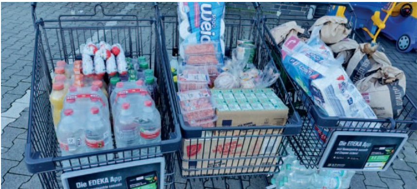
(immer wieder interessant, welche Mengen an Lebensmittel pro Tag so drauf gehen)