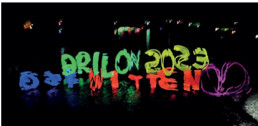
(schon stark, was man so fotografieren kann ❖)