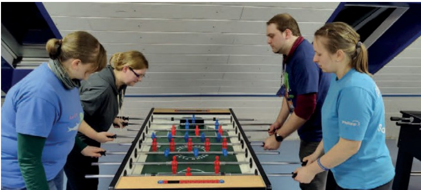
(genau wie harte Kicker Duelle ♠)