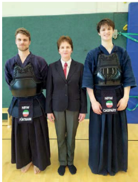
Deutsche Einzelmeisterschaft der Männer 2023