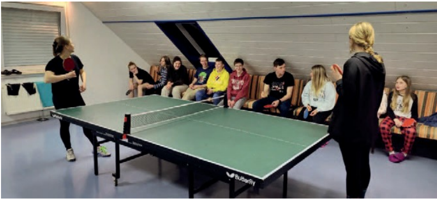
(ein Tischtennis-Turnier gab es dieses Jahr natürlich auch)