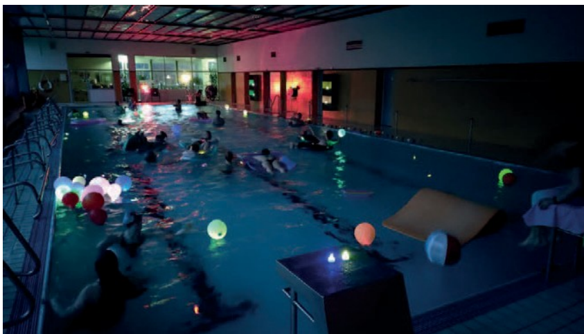
(eine abendliche Poolparty durfte natürlich nicht fehlen)

Hier noch ein paar Impressionen von der Fahrt: